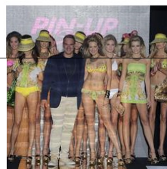
Pin up stars wiosna - lato 2013