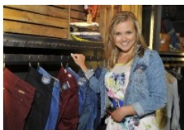
Wrangler i Lec – na jesień i zimą 2013/14