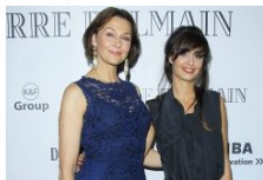
Pierre Balmain w Polsce