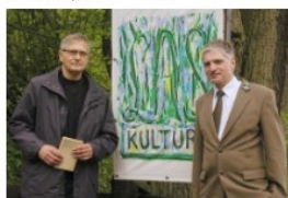
Las Kultury posadzony po raz drugi