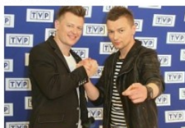
Wielka Matura Polaków – zadania ściśle fajne