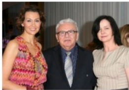
Dobroczynca Roku wybrany po raz 16.