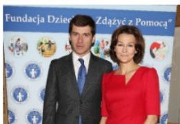
Fundacja Dzieciom „Zdążyć z Pomocą” przyznała nagrody